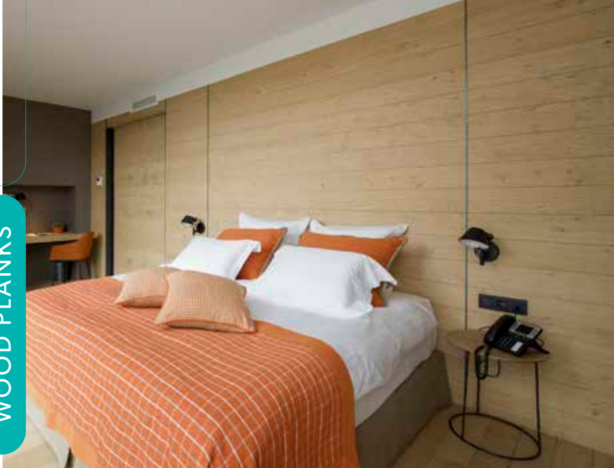
Oak Natural Vivace