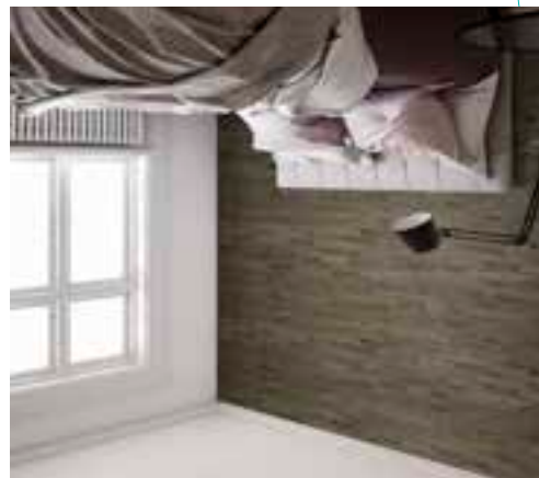
Oak Vintage original Hoboken