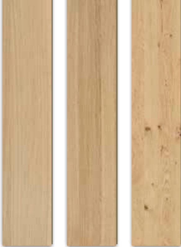
Oak Natural Adagio