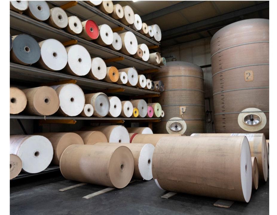
Rollen papier voor de productie van HPL

Genau hier stellen wir, die Firma Ludwig Leitermann GmbH & Co. KG, als langjähriger Partner der Firma Blok Plaatmateriaal unserer ganze Stärke und langjährige Erfahrung im Bereich dekorativer Oberflächen mit dem Markennamen LEITOPAL unter Beweis. Wichtig ist uns hierbei, von Anfang an die Wunsch und Anforderungen der Firma Blok und deren Kunden in Erfahrung zu bringen, diese in Optik und Haptik umzusetzen und das richtige Material auszuwählen. Unterschiedlichste Materialien wie echtes Holz, Steinoberflächen, Unifarben nach Kundenvorgabe oder sogar Metallplatten werden auf Holzwerkstoffe und HPL Oberflächen abgebildet und für die Verarbeitung in Schreinereien aufgebracht. Brandschutzplatten in verschiedenen Ausführungen werden hier genauso hergestellt und bearbeitet wie magnetisierende und beschreibbare Oberflächen. Eine schnelle Herstellung aussagekräftiger Muster - in einer für den Kunden beurteilbarer Qualität - sind hierbei genauso wichtig wie die persönliche Beratung über exakte Eigenschaften der Materialien und deren Einsatzgebiete. Die Haptik und Anmutung der Materialien steht hierbei immer an erster Stelle. Eine gespachtelte Oberfläche, welche in Handarbeit mehrere Hundert Euro kostet, darf als HPL oder Melaminplatte dem Original in nichts nachstehen. Dies ist der gemeinsame Anspruch von Jan Blok und Ludwig Leitermann.